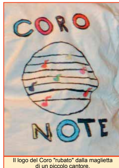
Il logo del Coro "rubato" dalla maglietta di un piccolo cantore.