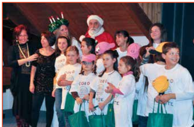
Il Coro al Concerto di S. Lucia della Federazione Cori il 13 dicembre 2013