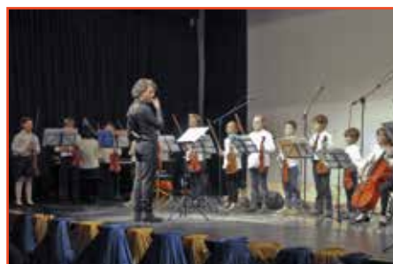
Due immagini degli allievi del Corso di propedeutica del Conservatorio "Dall'Abaco" di Verona

A consegnare le borsette che contenevano il tutto è arrivato in sala, vista la data, Santa Klaus.