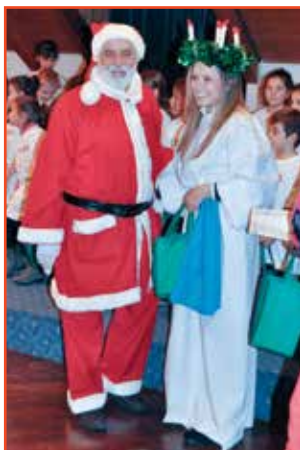
A premiare i piccoli coristi Babbo Natale e Santa Lucia