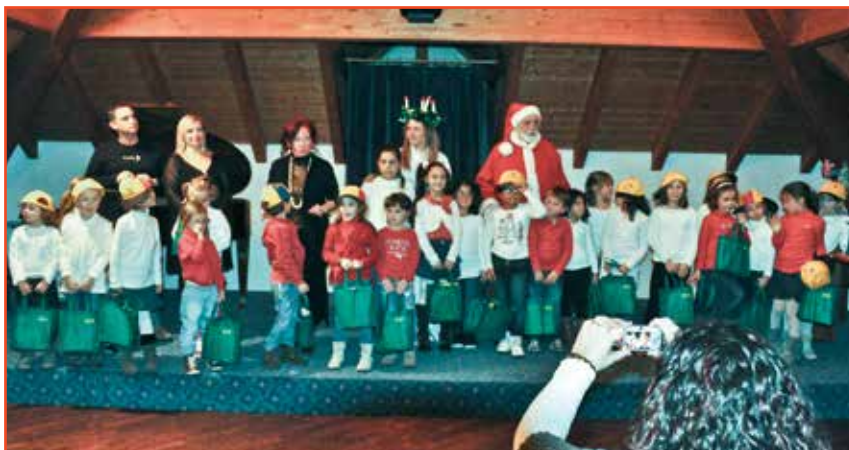
Il Coro Piccole Voci dei Monti Pallidi durante la premiazione finale