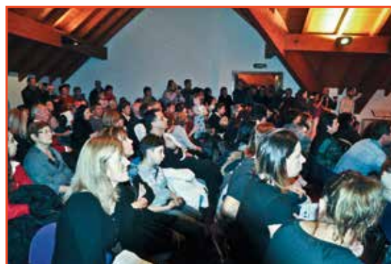
Attento e partecipe il pubblico presente

Molti complimenti ai piccoli interpreti ed ai loro Maestri preparatori, dotati di grandissima dedizione e molta pazienza, ricambiata, con gli interessi, dalle gioiose esibizioni dei piccoli/e coristi/e.