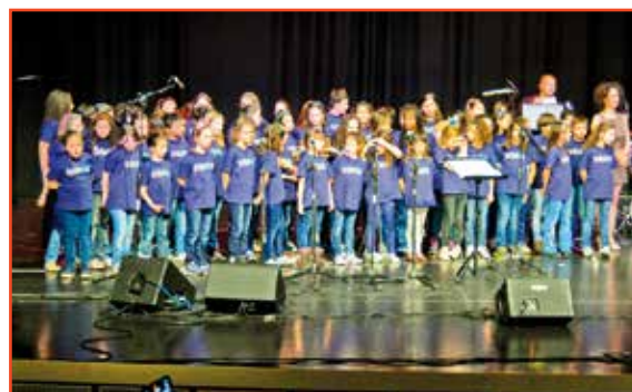
Immagini del Coro Doremix e, sopra, il Coro "Note di Classe"

Aspettiamo il Coro Doremix mercoledì 7 maggio nella Sala del liceo Pascoli per il Concerto di primavera della Federazione Junior e poi per la chiusura d'anno, venerdì 6 giugno al Teatro Cristallo.