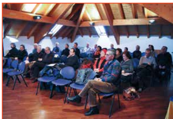
L'Assemblea, attenta e partecipe