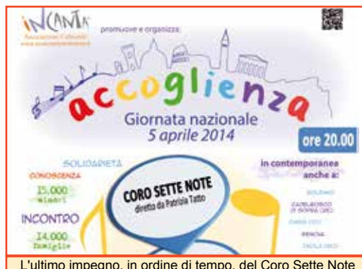
L'ultimo impegno, in ordine di tempo, del Coro Sette Note