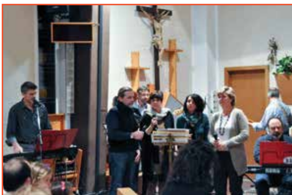
Il gruppo musicale degli Arcanta