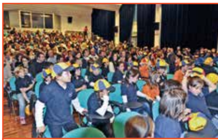
Un'immagine della sala durante il Concerto