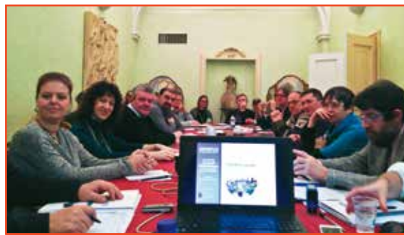
La sala dell'incontro durante i lavori.

A riprova dei buoni risultati raggiunti e del clima costruttivo instaurato, i partecipanti hanno chiesto di intensificare le possibilità di contatto, rendendo la frequenza degli incontri annuale.