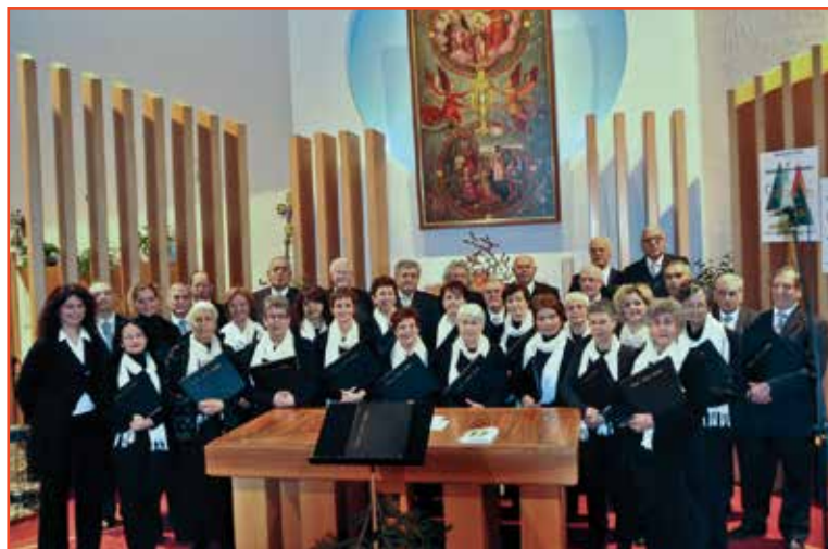
La Corale Corpus Domini organizzatrice del Concerto, al completo.

Possiamo dire con soddisfazione che, anche nel Natale 2013, "la bellezza ci ha accompagnati, è stata dietro di noi, di fronte a noi, sopra di noi, sotto di noi, tutt'intorno a noi..." ... e che quello di quest'anno, a giudicare dal successo, è sembrato essere stato, forse, il Concertissimo di Natale della Corale Corpus Domini che ha coinvolto di più la Comunità e gli amici: il più ben voluto ed apprezzato, anche per l'atmosfera di bellezza, di gioia e di auguri che ha saputo creare.