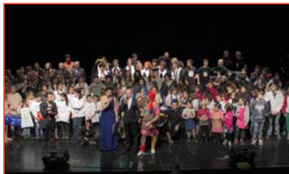
Assieme agli altri protagonisti della "Corrida per Chernobyl", le maglie bianche del Coro Sette Note.