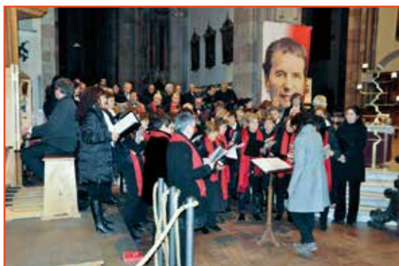
A Cori riuniti l'esecuzione di "Ave Verum Corpus" di Mozart

La città di Bolzano è particolarmente legata al Santo per avere un intero quartiere a lui dedicato, come ha ricordato il Sindaco nel suo intervento di saluto all'interno del Duomo di Bolzano lo scorso 4 dicembre.