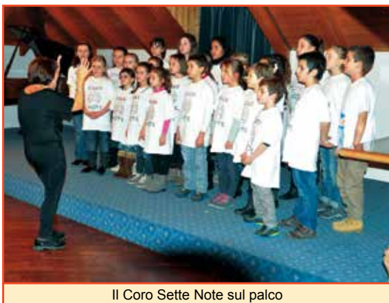
Il Coro Sette Note sul palco