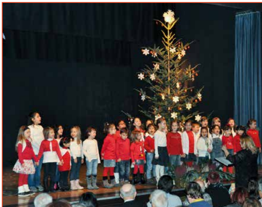
Il Coro Piccole Voci dei Monti Pallidi in Concerto ad Egna lo scorso 14 dicembre