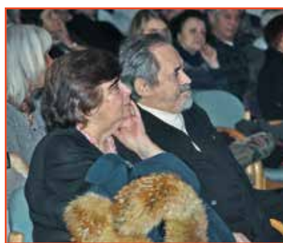
I quattro Cori in Concerto ad Egna.

Dall'alto: le "Piccole Voci dei Monti pallidi", i padroni di casa della Corale "San Nicola", i "Cantori del Borgo" ed il Coro "Monti Pallidi".