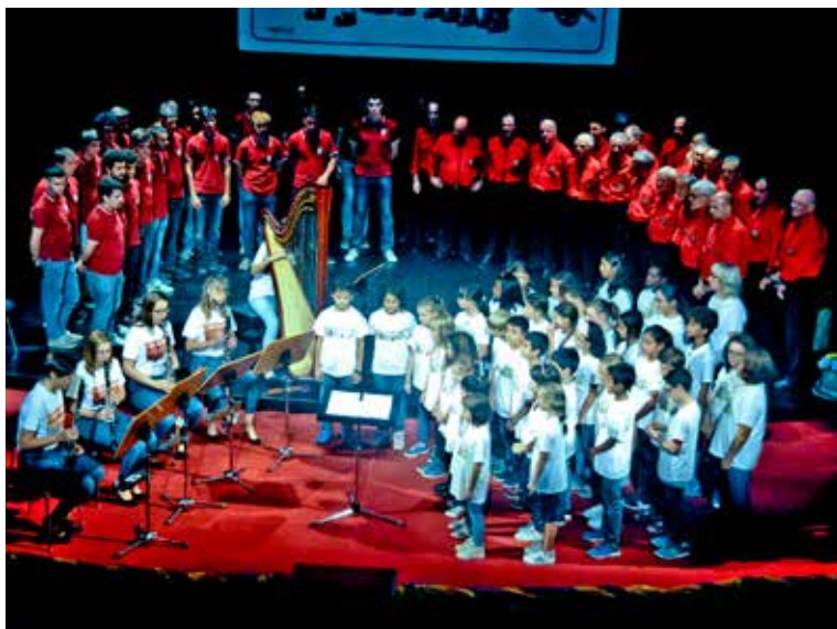
Tutti sul palco per l'apertura con l'Inno nazionale.