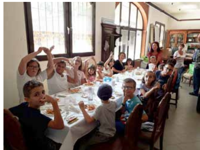
Pranzo tutti insieme

Tutte le edizioni sono state monitorate dalla somministrazione di un questionario che ha certificato il gradimento delle iniziative.