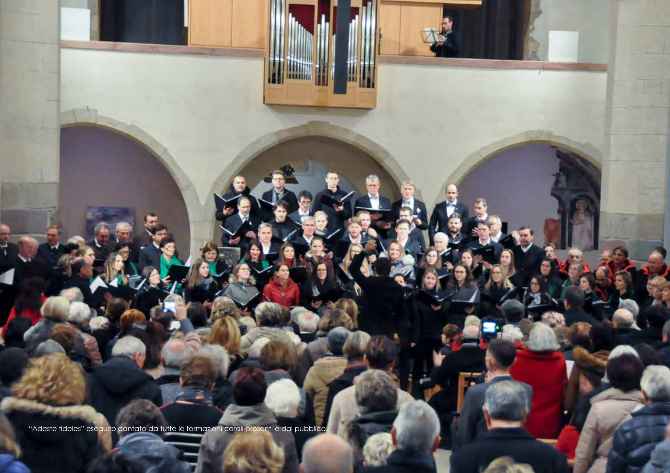
"Adeste fideles" eseguito cantato da tutte le formazioni corali presenti e dal pubblico.