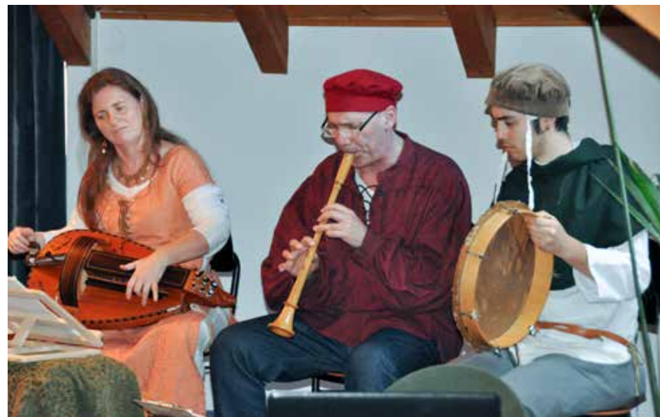
Musica medievale con l'ensemble "Hortus Musice" ad impreziosire la conferenza sui "Carmina Burana"