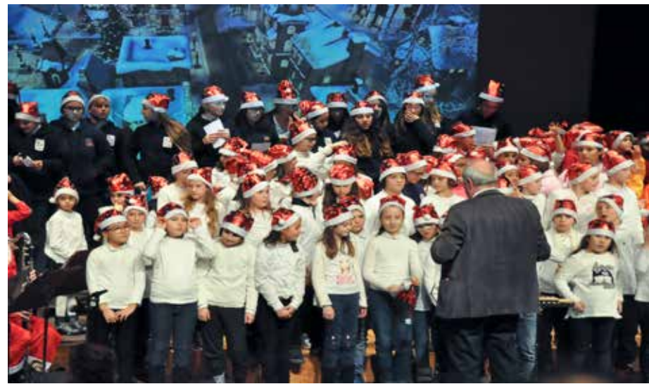
Coro "Marcelline" diretto da Marco Mantovani