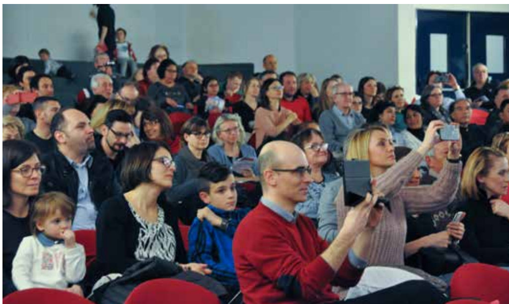
Il pubblico presente