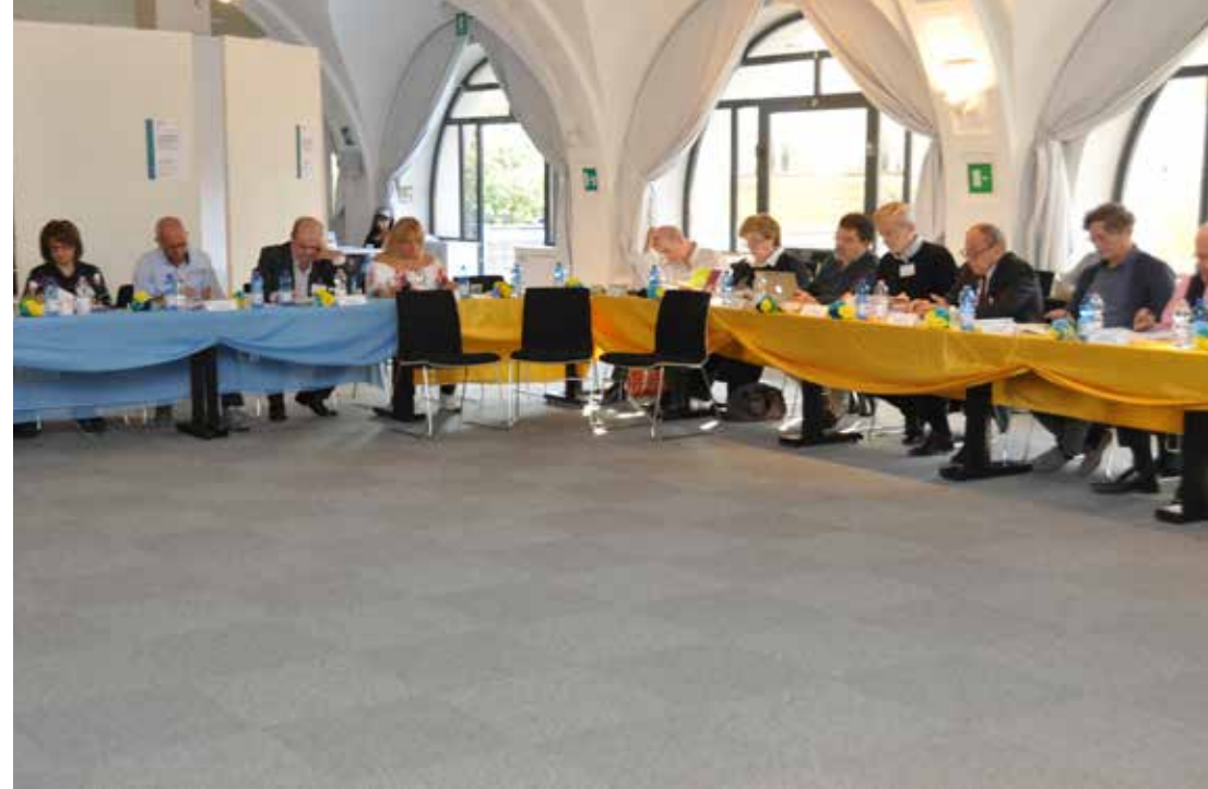
Momenti dei lavori dell'Assemblea.

Gli ospiti prima di congedarsi e raggiungere le proprie regioni si sono riproposti di ritornare presto, non solo per riunioni o impegni istituzionali, ma anche per diletto personale tanta è stata la ricaduta positiva anche grazie a piccoli doni ricevuti dall'Ufficio turistico e consegnati agli ospiti.