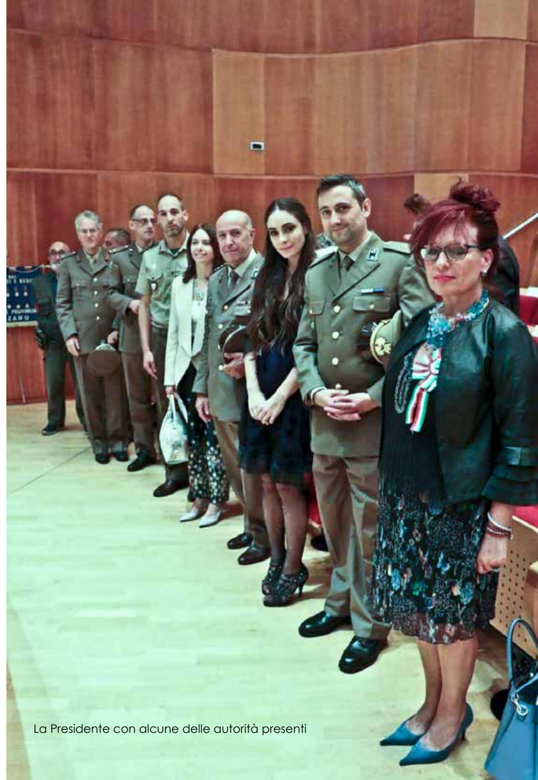
La Presidente con alcune delle autorità presenti