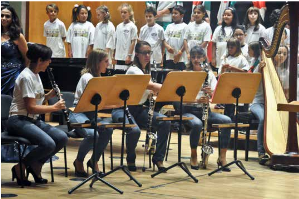
Il gruppo strumentale