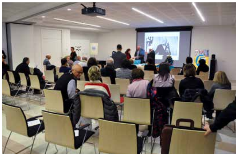
Aspetti inusuali della figura di Charlie Chaplin messi in luce da Marco Mantovani; oltre che attore e regista anche compositore istintivo, ma di grande talento.

Ne è emerso un quadro inedito del grande artista Chaplin il quale è rimasto quasi sempre nell'ombra per la sua originalissima opera musicale che efficacemente è servita a rendere ancora più straordinarie ed irresistibili le scene dei suoi film che ormai appartengono alla storia ed al mito del grande cinema