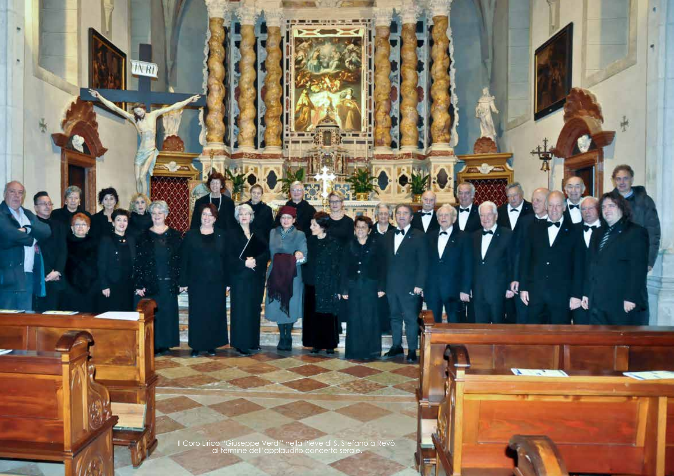
Il Coro Lirico "Giuseppe Verdi" nella Pieve di S. Stefano a Revò, al termine dell'applaudito concerto serale.