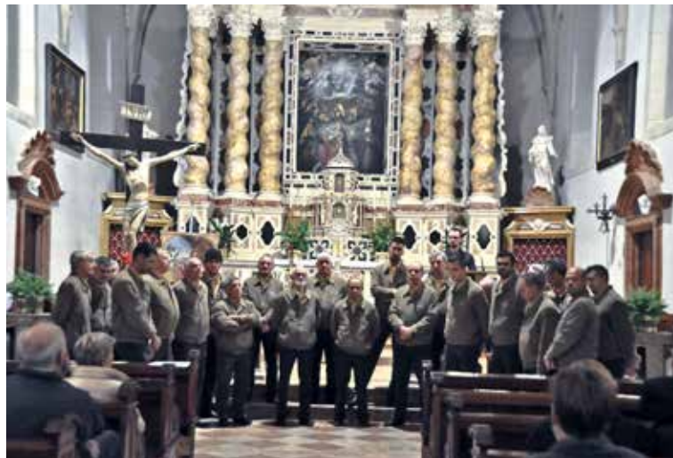
I padroni di casa del Coro "Maddalene" aprono il Concerto serale.