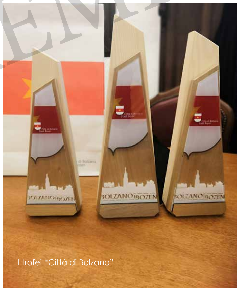
I trofei “Città di Bolzano”

I vincitori dovranno presenziare alla cerimonia di premiazione, pena la decadenza dal premio stesso.