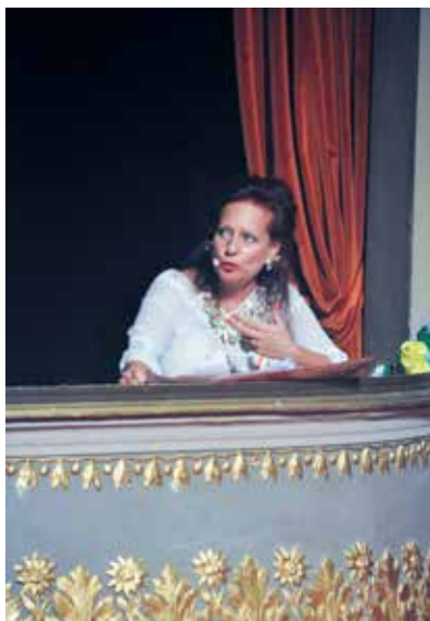
La Presidente d.d.r. Paternoster sviluppa la sua relazione