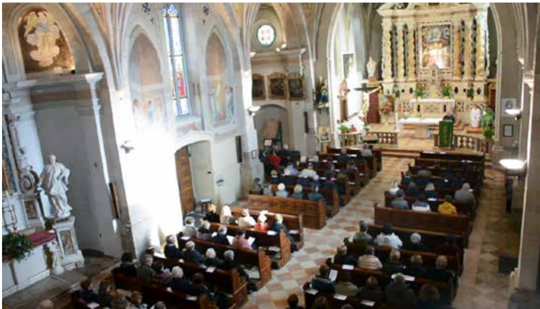
"Messa Granda" a Revò: la Chiesa dalla cantoria

DECANATO DI CLES PARROCCHIA REVO' - PIEVE S. STEFANO