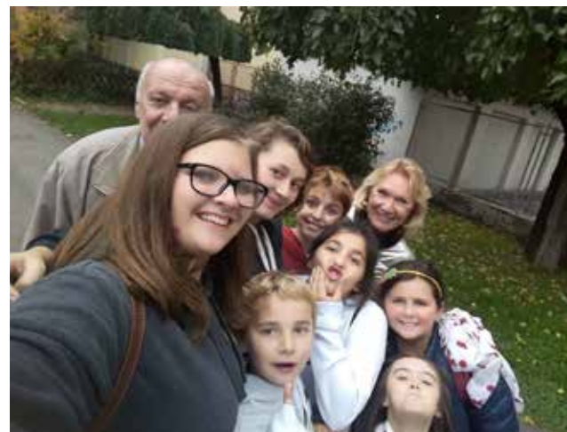
Immagine dai "Campus della coralità"