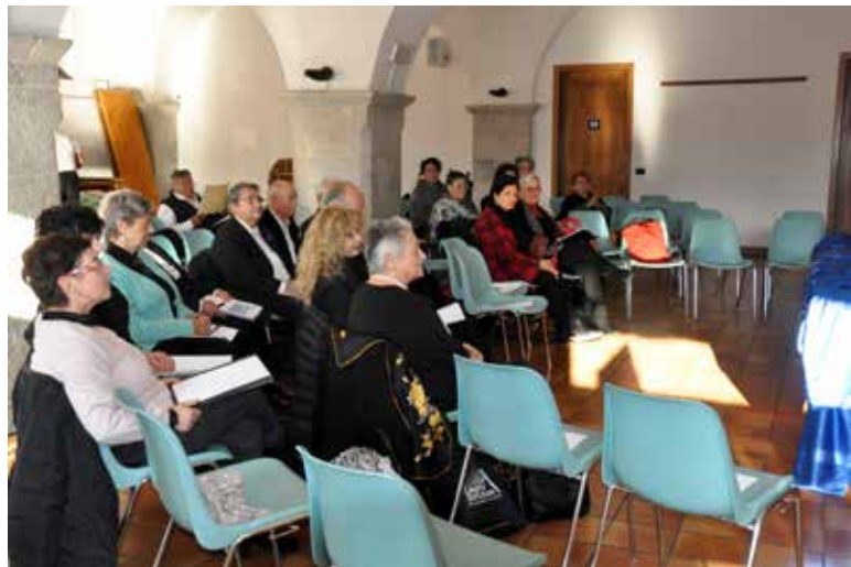
Il Coro lirico Verdi durante le relazioni.