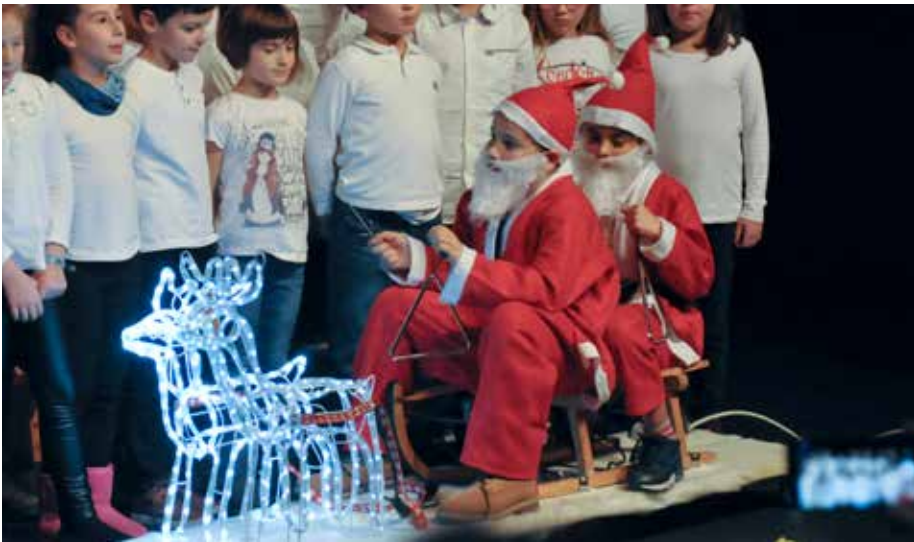
Coreografia natalizia sul palco per l'esecuzione dell'inedito brano "Babbo Natale".