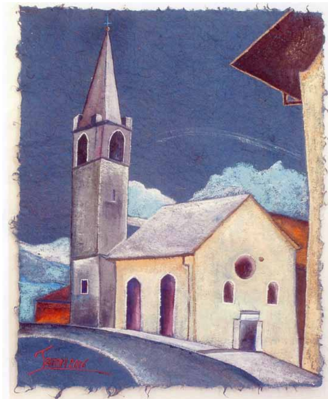
Chiesa BEATA VERGINE DEL CARMELO tecnica mista