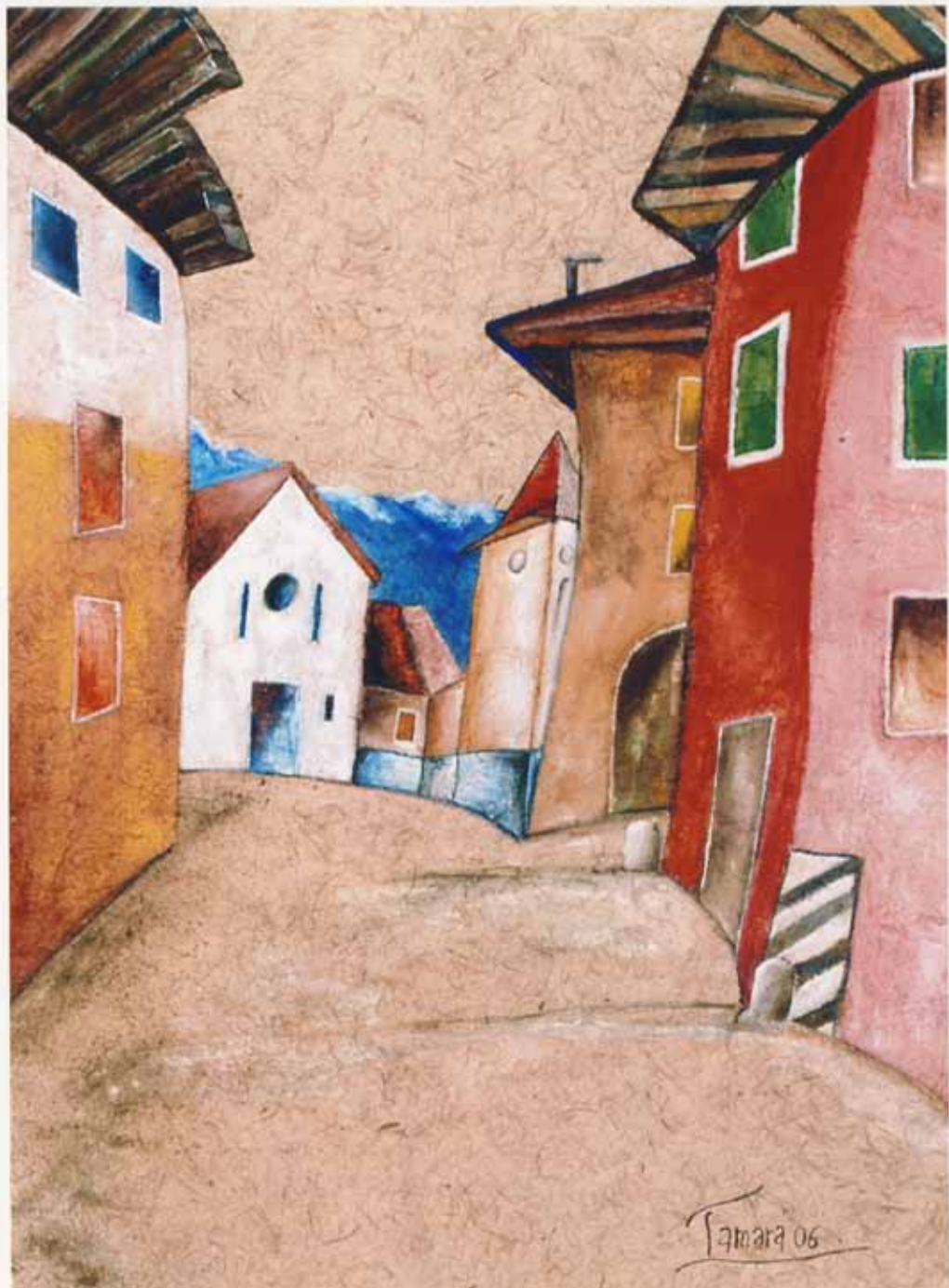
ANGOLO DEL PEROLAI tecnica mista opera di Tamara Paternoster Mantovani