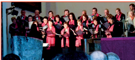
I nostri rappresentanti della Corale Santo Spirito