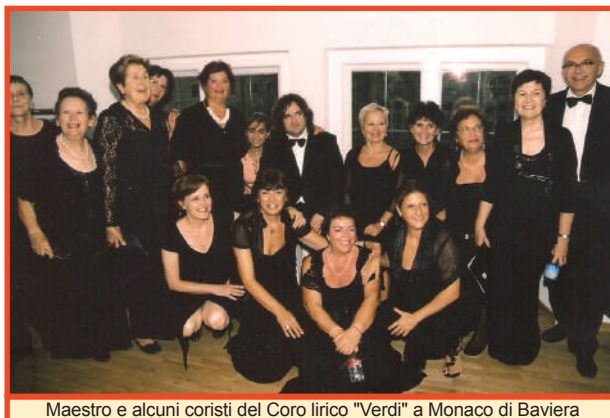
Maestro e alcuni coristi del Coro lirico "Verdi" a Monaco di Baviera

Erano duecento di questi ragazzi che erano stati convocati dall'Accademia Musicale di Monaco per il luglio 2012 a Bressanone, per lo studio della monumentale "Seconda Sinfonia di Mahler".