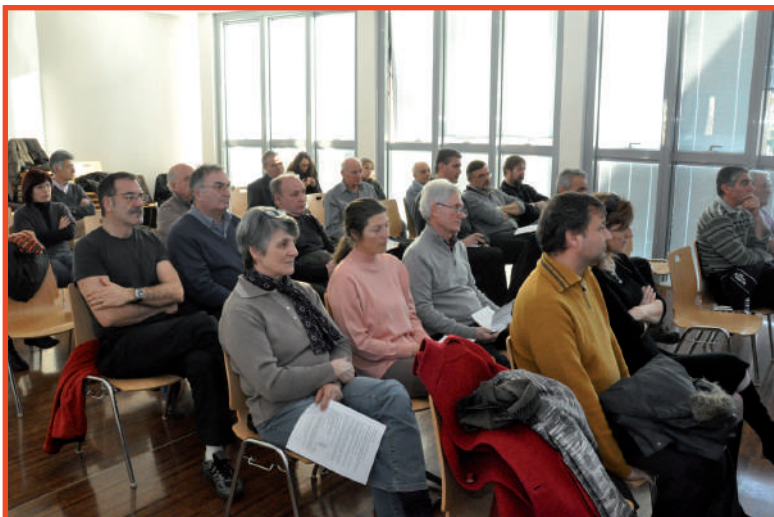
Folta la presenza dei Presidenti dei Cori federati e dei loro rappresentanti.

L'Assemblea apprezza le proposte presentate ed il grande entusiasmo con il quale vengono sostenute e si dichiara disponibile a dare appoggio alle stesse alla loro presentazione.