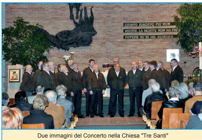
Due immagini del Concerto nella Chiesa "Tre Santi"