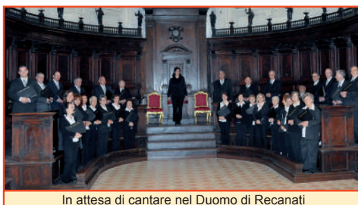
In attesa di cantare nel Duomo di Recanati