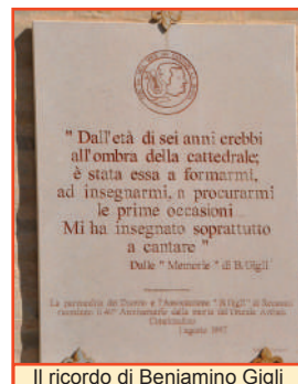
Il ricordo di Beniamino Gigli

La casa natale del Leopardi (e i ricordi, scolastici e non, della sua poesia) si sono presentati in una bella giornata di sole che ha accompagnato il rientro e la conclusione di tre giornate utili a rinsaldare amicizie ed esperienze comuni.