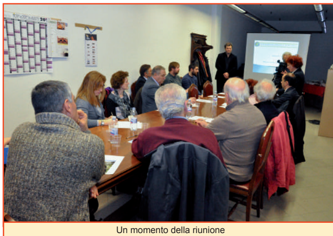
Un momento della riunione

Vista la giornata, è stato presentato a tutte le donne presenti un gradito omaggio floreale; anche questo un segno di attenzione per tutte le signore che, a vari livelli, rendono grande la Federazione.