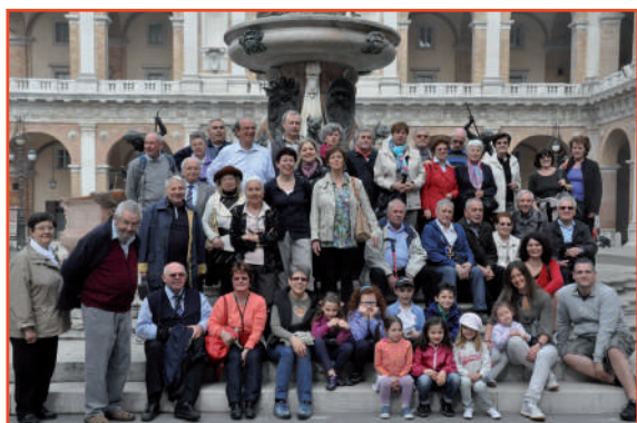
Il gruppo dei partecipanti alla trasferta, nella piazza del Santuario di Loreto. Oltre ai coristi/e, parenti, amici anche otto splendidi bimbi/e.

Punto centrale della trasferta il Santuario Mariano della Santa Casa di Loreto che ci ha visti pellegrini nella mattinata di sabato 27 aprile; muniti di radiolina ed auricolare abbiamo ammirato le bellezze della Basilica lauretana ed ascoltato la storia e le vicende legate al sacro luogo così come narrate da una guida.