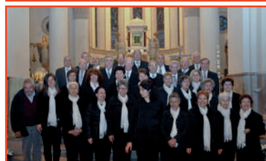
Sopra una vista del santuario di Campocavallo. Sotto la Corale con, sullo sfondo, l'edicola con il quadro venerato.

per quasi dieci anni, davanti ad autorevoli testimoni, ha mosso gli occhi a guardare i fedeli devoti italiani e stranieri. Il Santuario è retto dai padri dell'Ordine dei Francescani dell'Immacolata; il priore del Santuario, con