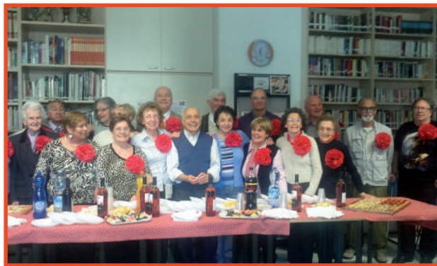
Due immagini di festa della Corale ANTEAS