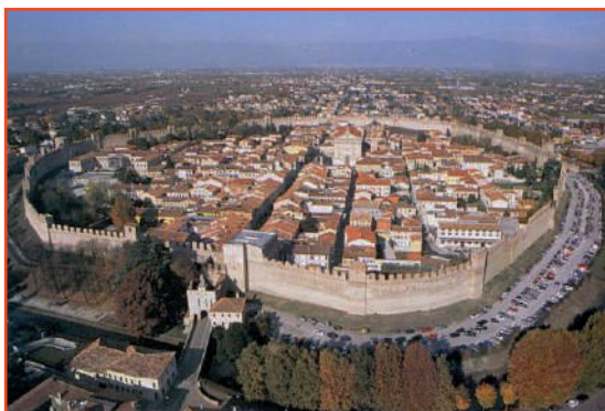
Cittadella, meta della trasferta del Coro Monti Pallidi di Laives

porte. Queste sono orientate secondo i punti cardinali, rivolgendosi a sud verso Padova, a ovest verso Vicenza, a nord verso Bassano e a est verso Treviso.