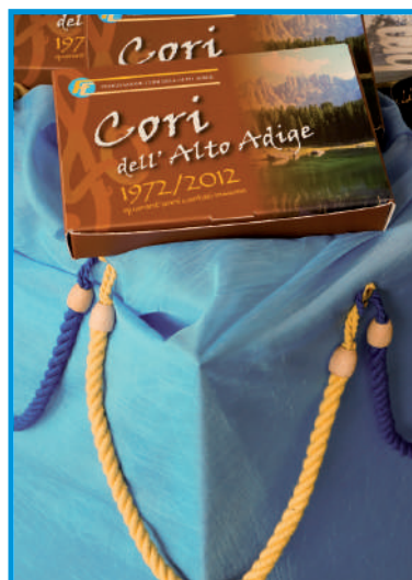
Molta attenzione per il cofanetto del 40°. Sotto: contatti e scambi di informazioni fra addetti ai lavori.