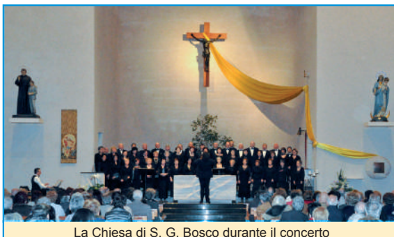
La Chiesa di S. G. Bosco durante il concerto