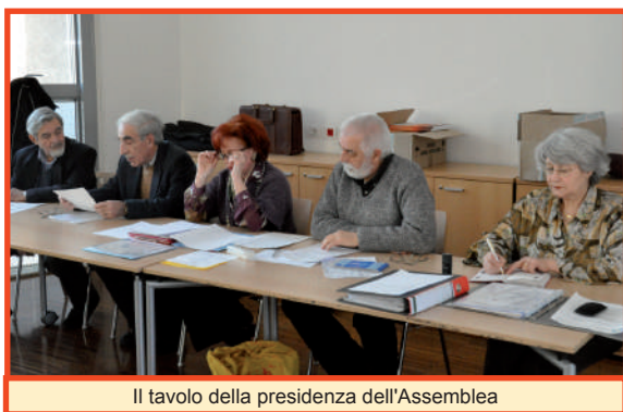
Il tavolo della presidenza dell'Assemblea