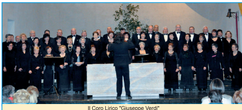
Il Coro Lirico "Giuseppe Verdi"

Giusto riconoscimento i grandi applausi del pubblico a tutti i partecipanti, con la richiesta dell'immane bis finale del trascinate "Va pensiero".