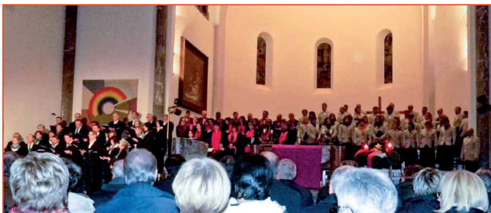
Vista d'insieme dei sei cori presenti al Concerto di Natale AGACH