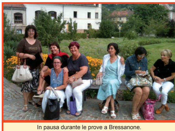
In pausa durante le prove a Bressanone.

Ci siamo ritrovati in un ambiente amichevole, creativo; novanta coristi giovani e giovanissimi e solisti eccezionali.