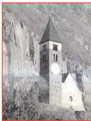
La caratteristica chiesetta che domina l'abitato di S. Giacomo.

Romedio ha attualmente la sua sede a Romeno ed è composto da trentasei elementi che provengono da una decina di paesi gravitanti attorno al Santuario di S. Romedio, dal quale il complesso canoro prende il nome.