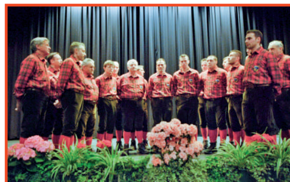
I due Cori protagonisti della serata di Magrè: a sinistra il Coro Castel Bassa Atesina, a destra il Coro Genzianella di Roncogno