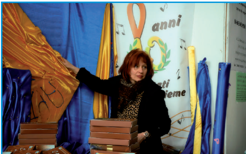
L'artistico stand allestito dalla Presidente e dal suo staff a Verona

non troppo distante, il raggiungimento di una partecipazione attiva, dalla qualità elevata, quale elemento promotore e stimolante per la vocalità.