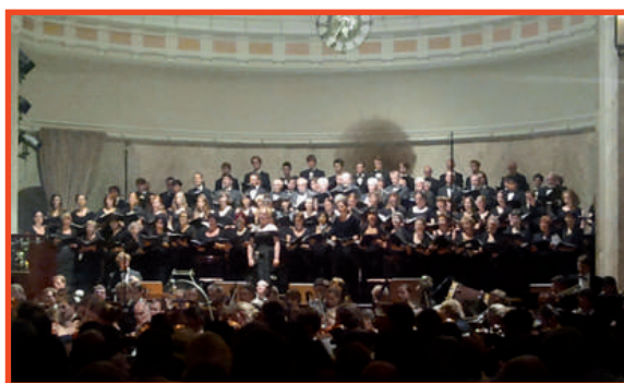
Concerto al Kursaal di Merano

Il 4 agosto c'è stata la presentazione dell'opera nel grande concerto al Kursaal di Merano. Noi del Verdi eravamo in prima fila, attenti e tesi come corde di violino, aspettando la quinta parte, quella corale appunto. Un'esperienza esaltante!