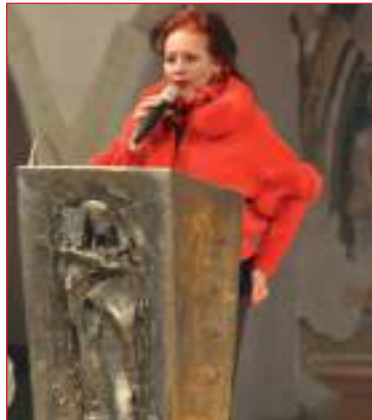
Il benvenuto della Presidente della Federazione organizzatrice.