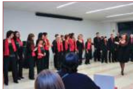
Lomaggio dei Vocalists "LE PLEIADI" ai delegati