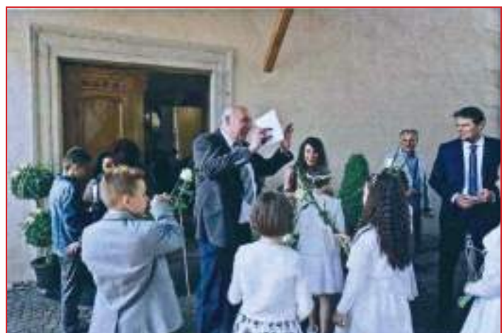
Ultime indicazioni prima della Messa.