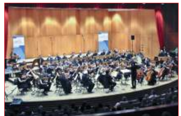
Merano Pop Symphony Orchestra