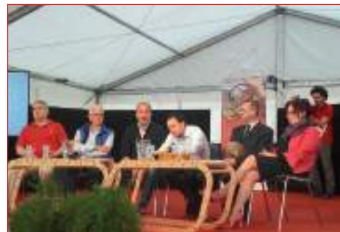
I relatori dell'incontro