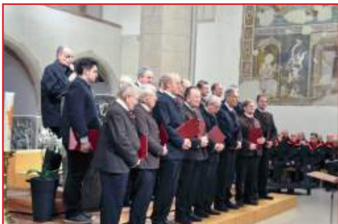
S. E. Mons. Muser ha curato le riflessioni. Nella foto Gesangverein ELLMOSEN

Presenti numerose autorità locali, provenienti dall'estero e da altre regioni italiane, rappresentanti del mondo musicale ed i Presidenti, con le gentili consorti, delle 16 Federazioni associate all'AGACH.