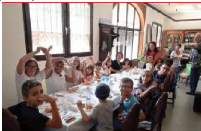
Momento di sosta al Campus autunnale

Causa lavori alla struttura del City College, l'edizione autunnale del Campus ha avuto luogo appoggiandosi alla sede della Federazione sul tema "Uno sguardo sulla Vienna asburgica".