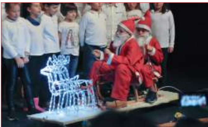
Anche Babbo Natale suona il triangolo ....