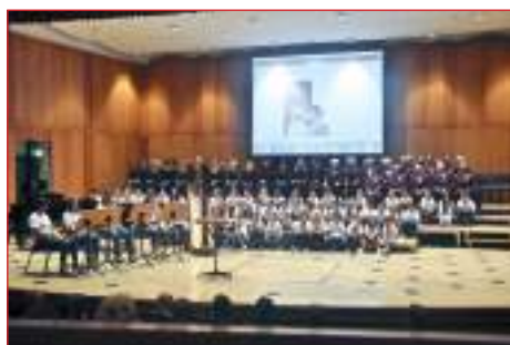
Il Coro Lirico "Verdi" ed i bimbi del Coro Marcelline