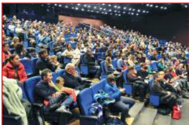
Al limite della capienza il Teatro Gries

Il programma è interamente natalizio e oltre alle performances dei cori partecipanti ha visto anche la presenza fattiva del gruppo strumentale "4Quartet Clarinet"