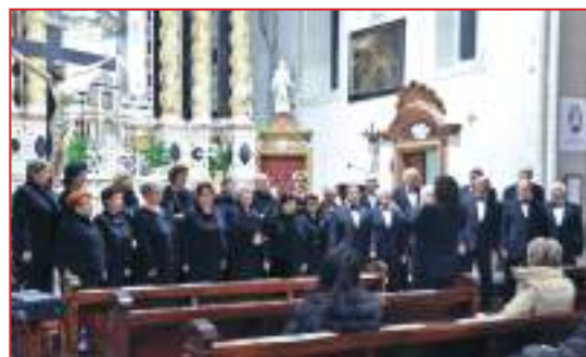
Il Coro Lirico "G. Verdi" durante il Concerto a Revò

dalene, coro che ha fatto gli onori di casa per lasciare poi al "Verdi" l'onore del Concerto. Il Coro lirico ha eseguito vari brani del suo repertorio tratto da autori come Bellini, Rossini, Donizetti Puccini, Mascagni, Verdi ma anche brani moderni composti dal Mo. Vadagnini inseriti