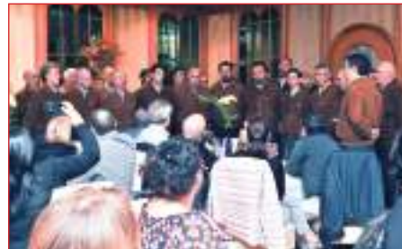
... ed il Coro ALIEVI SAT, Trento