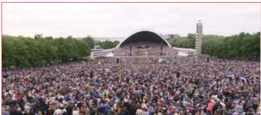
Grande concerto conclusivo con tutti i cori sul palco.