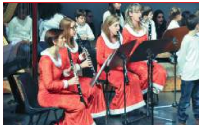
... e gli strumenti a fiato del 4QUARTET CLARINET