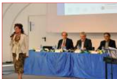
Il benvenuto della Presidente Paternoster ai delegati