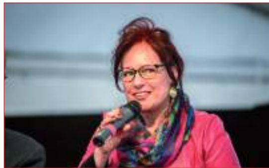
La Presidente Paternoster espone il proprio pensiero al Convegno