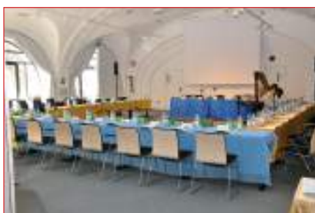
In attesa di ospitare l'Assemblea

Gli ospiti prima di congedarsi e raggiungere le proprie regioni si sono riproposti di ritornare presto, non solo per riunioni o impegni istituzionali, ma anche per diletto personale tanta è stata la ricaduta positiva anche grazie a piccoli doni ricevuti dall'Ufficio turistico e consegnati agli ospiti.