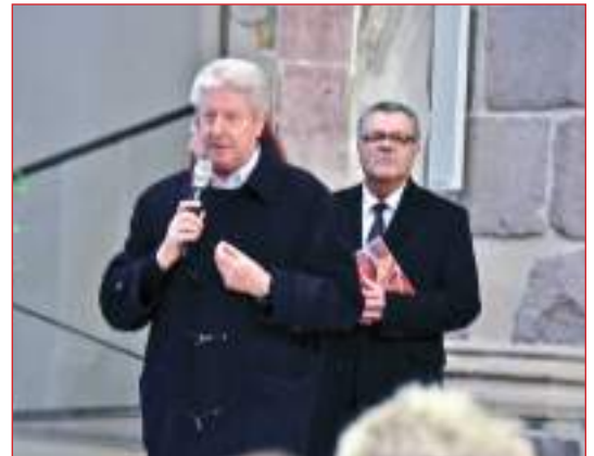
Il Sindaco di Bolzano Renzo Caramaschi saluta gli ospiti del Concerto di Natale