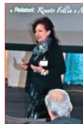
La Presidente Paternoster introduce la conferenza su Beethoven