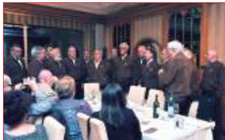
Il Coro LAURINO, Bolzano sorpresa durante la cena ...