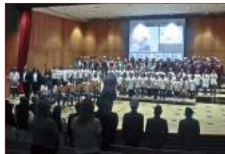
I partecipanti al Concerto eseguono l'Inno Nazionale