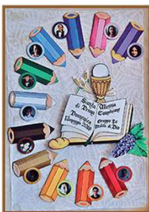
Dal cartellone il nome del Coro.