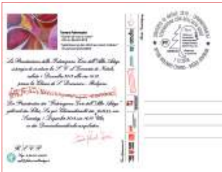
La cartolina predisposta per l'annullo speciale