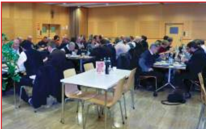
La cena conviviale nella Sala del Centro Kolping