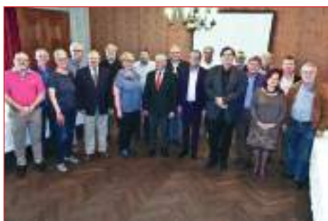
Riunione AGACH ad Innsbruck ...