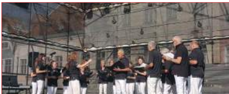
Il Coro DiapaSong della Scuola di Musica "Vivaldi" in concerto in piazza a Tallinn ...