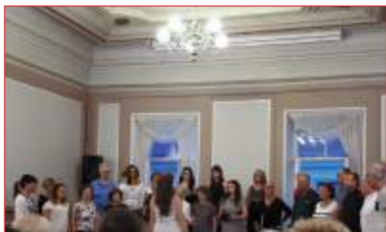
... e in Casa FENIARCO punto di ritrovo dei cori italiani.

A cadenza triennale, dal 1961, l'Associazione corale europea organizza il festival EUROPA CANTAT in un paese diverso: Così nel 2012 si è svolto a Torino, nel 2015 a Pecs (Ungheria), nel 2018 a Tallinn, nel 2021 sarà a Lubiana (Slovenia).