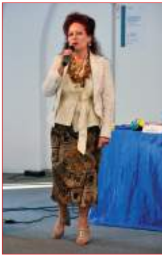
Il saluto della Federazione Cori dell'Alto Adige