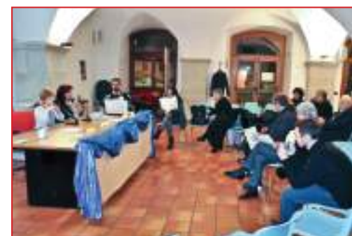
Riflessione della Presidente sulla Comunicazione nel project management

della sordità che ha fortemente limitato il compositore senza tuttavia impedirgli di lasciare opere innovative e durature nel tempo.