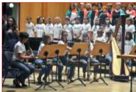
Le musiciste del 4Quartet Clarinet