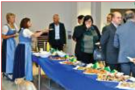
Momento di pausa