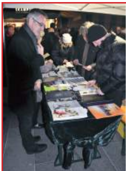
Annullo postale speciale molto richiesto.