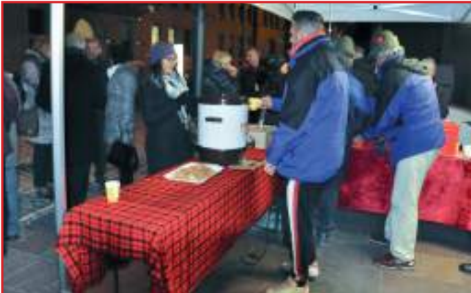
Gli Alpini del Gruppo Bolzano Centro in servizio