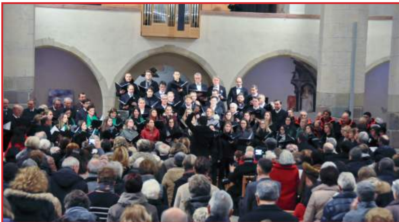
Canto finale d'assieme; i cinque Cori ed il pubblico presente intonano "Adeste Fideles" con supporto d'organo e tromba.

Emozionante il momento conviviale con i canti dei cori e la musica del sestetto che hanno saputo affascinare ed appassionare tutti.