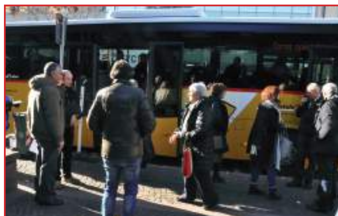
L'accoglienza riservata ai Presidenti e consorti delle Associazioni affiliate all' AGACH ...