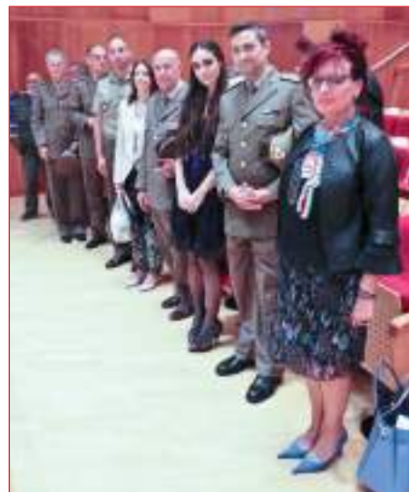
Le autorità presenti al Concerto

14. Domenica 23 settembre, Teatro Puccini, Merano edizione conclusiva del ciclo "NOTE DAL FRONTE", celebrazione del Centenario della Grande Guerra. Questa quarta edizione ha visto la partecipazione del Coro Alpini Politecnico di Milano , e del Coro Monti Pallidi, Laives . Hanno partecipato inoltre il Coro di Voci Bianche dell'Istituto Marcelline, Bolzano ed il Coro CORlandoli della Scuola di Musica, Bolzano oltre alle musiciste del "Quartet Clarinet" ed al quartetto di bassi-tuba del Conservatorio "Dall'Abaco", Verona ed all'arpa di Emma Degano Wassler .