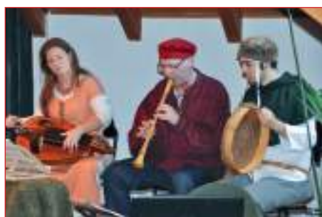
L'ensemble di musica medievale "Hortus Musicæ" nella conferenza sui "Carmina Burana"