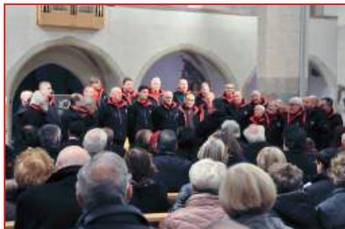
Il Coro Monti Pallidi di Laives rappresenta la Federazione Cori dell'Alto Adige.