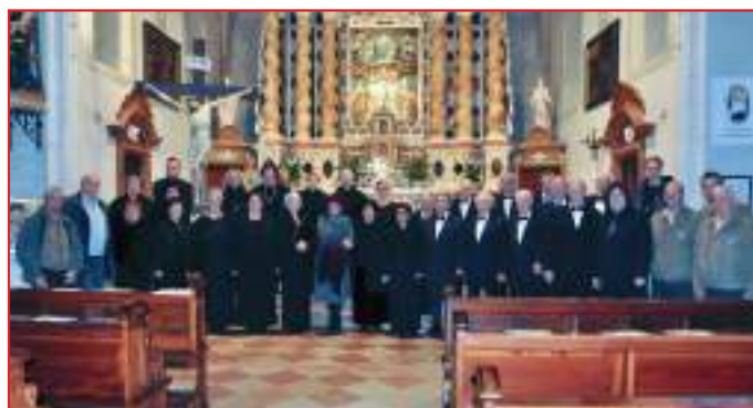
Immagine di chiusura

nell'opera "Aneta", scritta in lingua ladina.