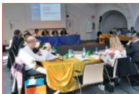
Apertura dei lavori