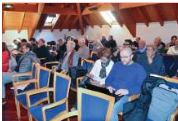
La sala dell'Assemblea della Federazione Cori dell'Alto Adige