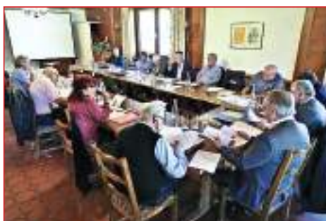
... ed a Susten/Wallis (CH)

E' stata inoltre confermata l'iscrizione presso la Società Dante Alighieri di Bolzano, nell'ottica di una sempre proficua collaborazione.