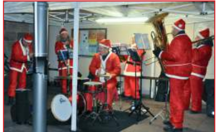
Il sestetto veronese "Venetum Brass" ha riscosso grande apprezzamento.