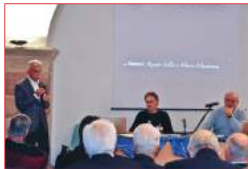
A Revò conferenza sulla malattia di L. v. Beethoven