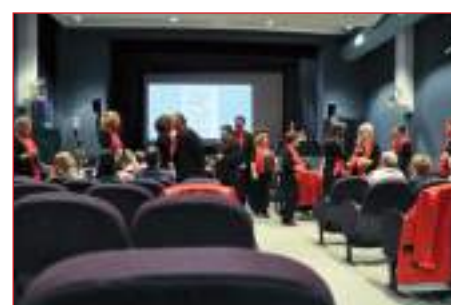
Nelle conferenze sul Jazz sempre molto apprezzata la presenza dello Showchoir Vocalists "Le Pleiadi"