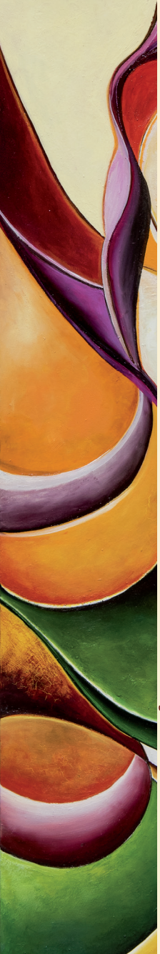
Tamara Paternoster "Traiettorie cromatiche", olio sul tela - "Chromatische Flugbahnen", Öl auf Leinwand (2014)