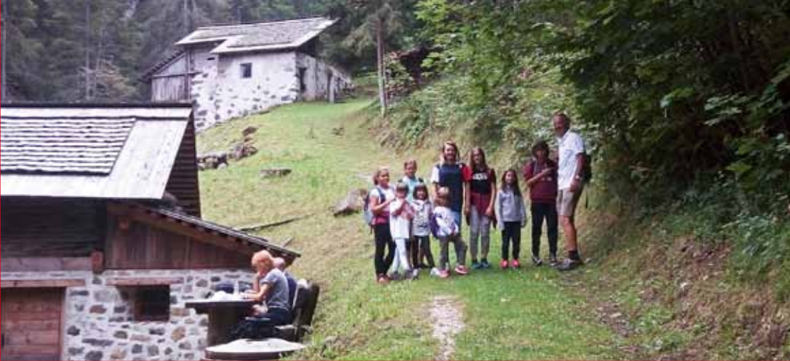
Gita a mulini e cascate nel bosco.