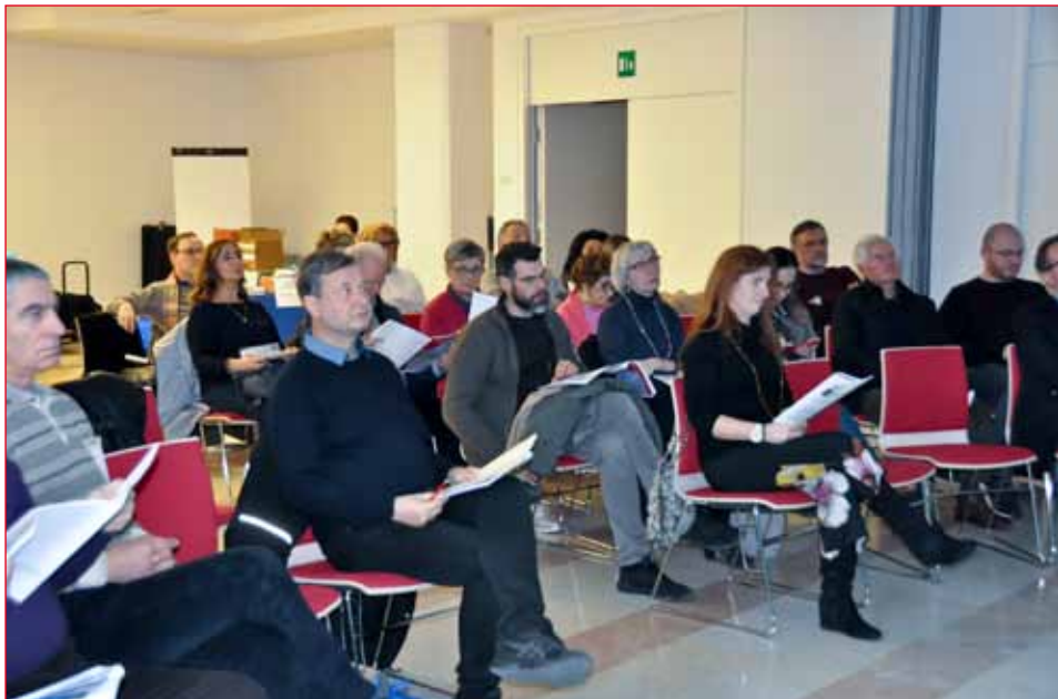
L'Assemblea durante i lavori