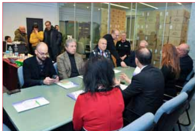
Il tavolo dell'incontro.