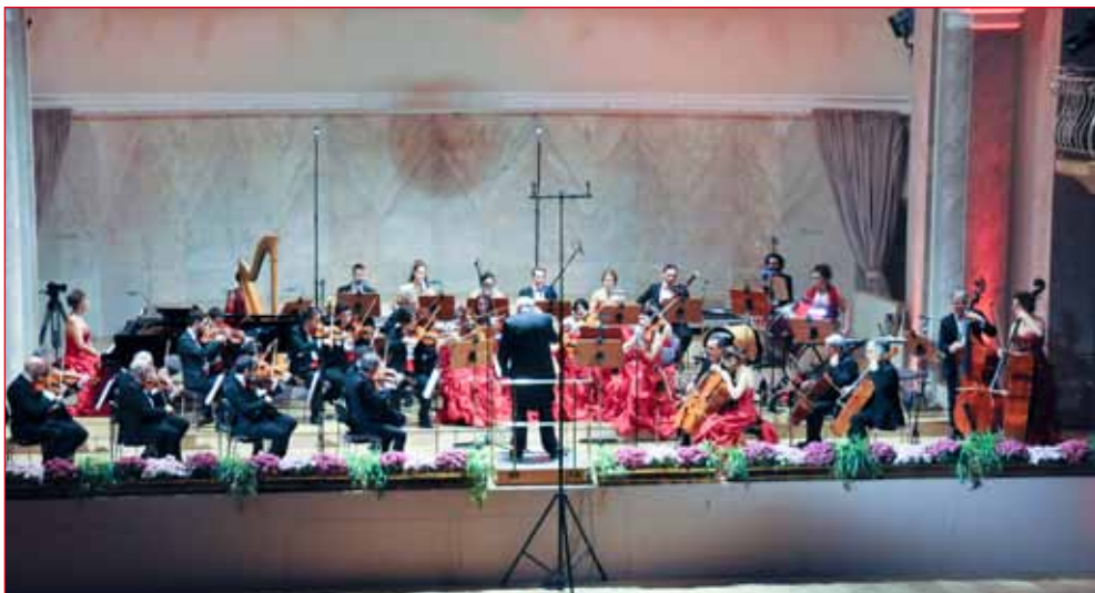
L'orchestra "Antiqua Estensis" sul palco del Kursaal