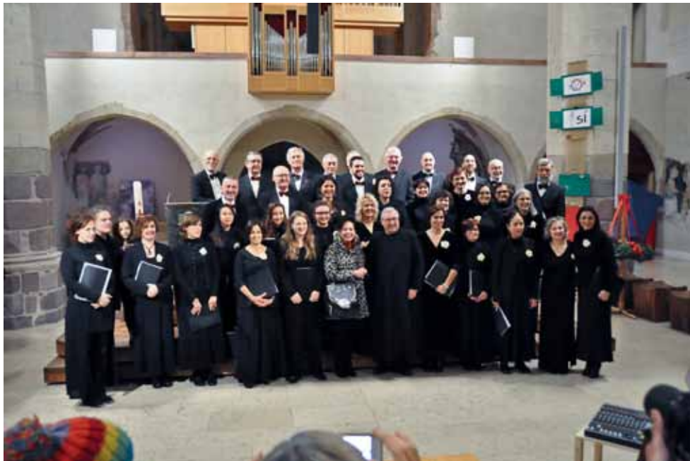
58 La Corale Polifonica di Sommariva Bosco (Cuneo) al saluto finale