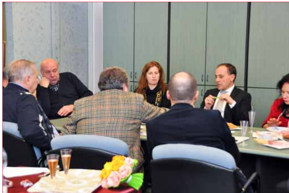
L'Assessore alla Cultura incontra il direttivo della Federazione Cori Alto Adige.

Inoltre va rammentato che all'assemblea ordinaria dei soci che si tiene in gennaio viene consegnato un report contenente l'attività dell'anno finanziario concluso e una programmazione triennale.