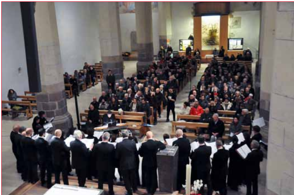
La Corale Polifonica di Sommariva Bosco (Cuneo)