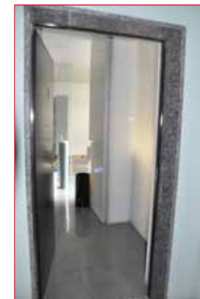
Alcune immagini della nuova sede.