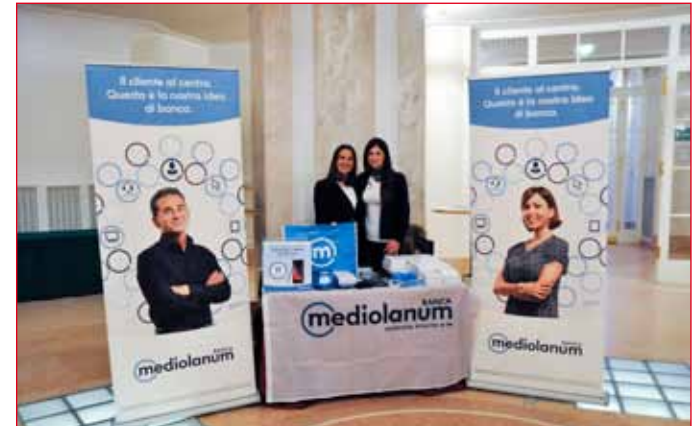
Lo stand della Banca Mediolanum, uno degli sponsor.