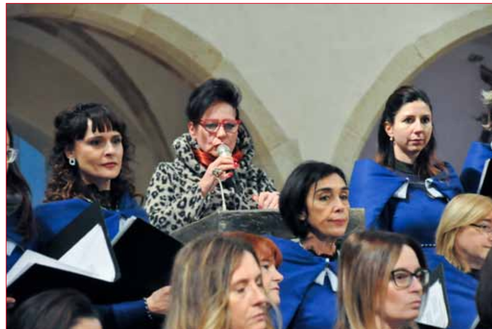
Il saluto di benvenuto della Presidentessa.