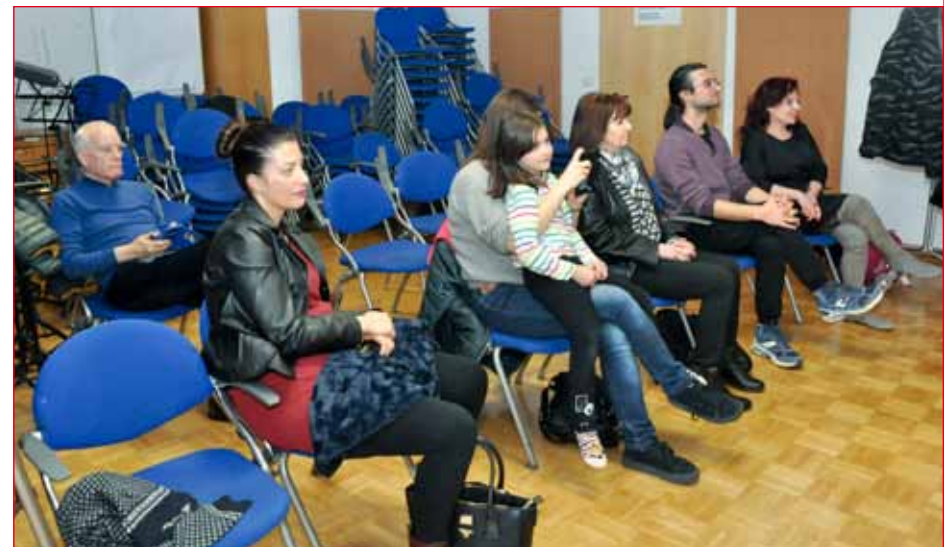
I genitori al saggio finale.