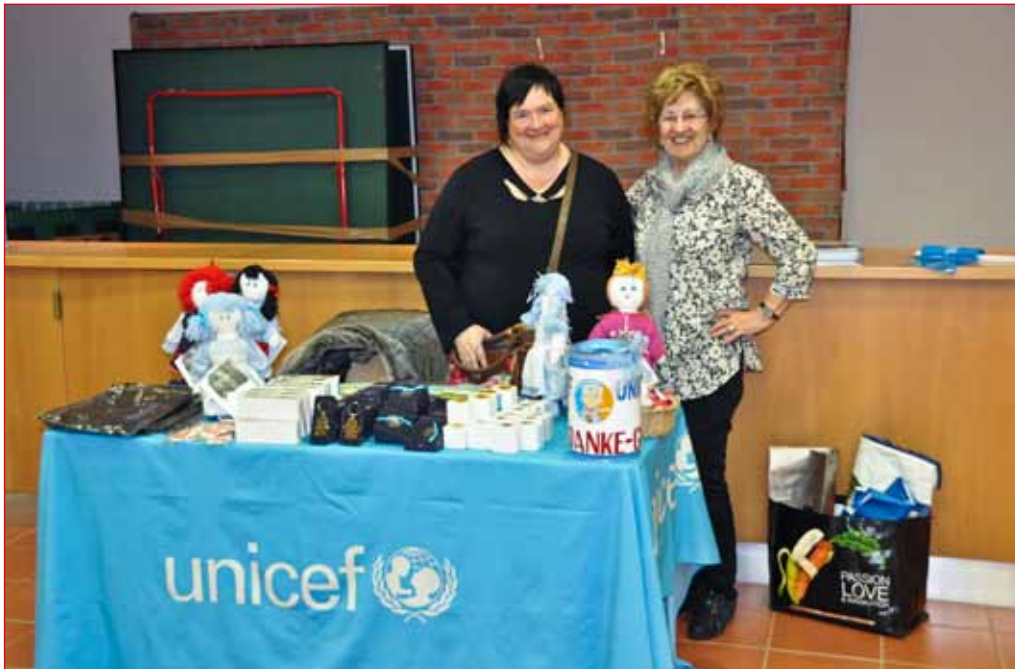
Lo stand dell'UNICEF, occasione per i ragazzi/e di comprendere scopi e finalità dell'Ente.