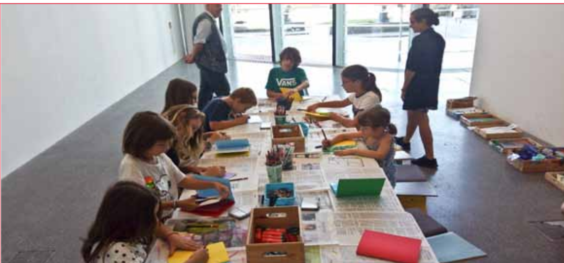
Laboratorio creativo al Museion