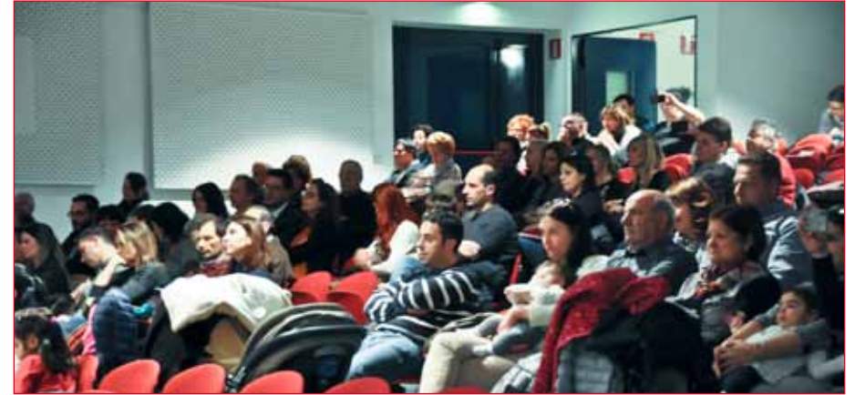
Parte del pubblico presente