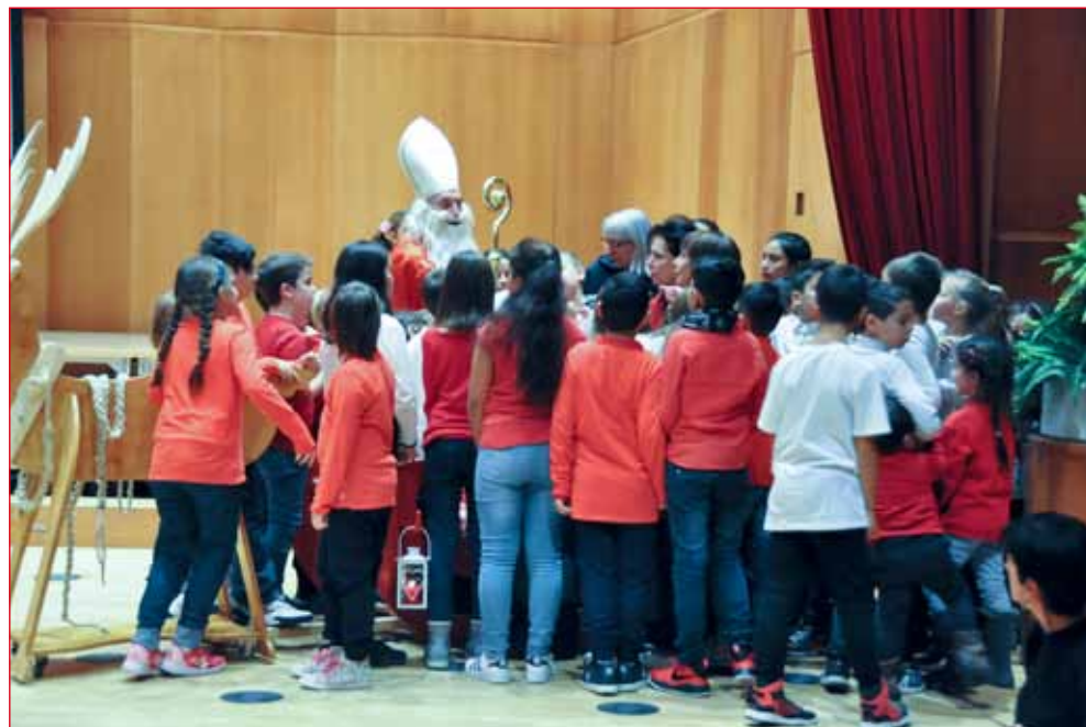
Non poteva mancare la distribuzione dei doni da parte di S. Nicolò.