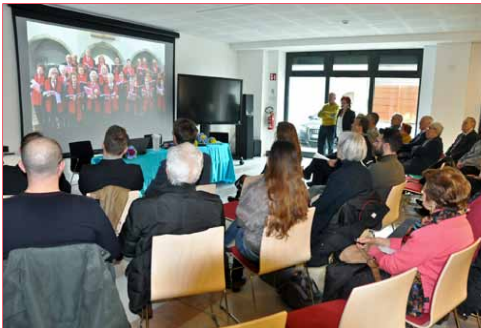
Il trailer di apertura ha riscosso grande interesse.