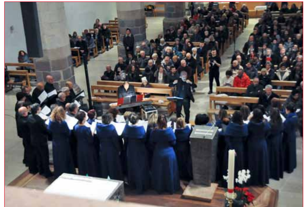
La Corale Polifonica Non Nobis Domine, Merano