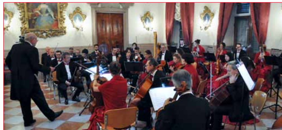
L’Orchestra “Antiqua Estensis” di Ferrara nel Salone d’Onore di Palazzo Mercantile.