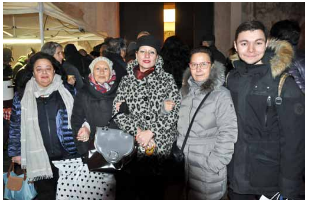
Lo staff della Federazione Cori organizzatrice del Concerto.