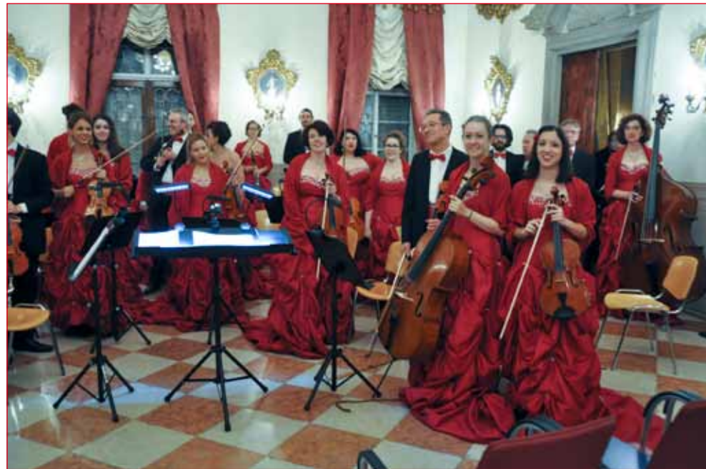
Molto eleganti gli abiti delle orchestrali disegnati per l'occasione.