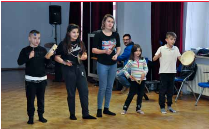
Piccoli musicisti alla performance conclusiva del Campus primaveraile.