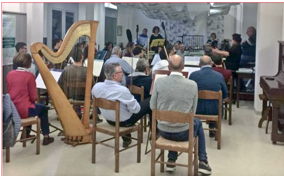
Estate di prove nella Sala della Scuola di Musica Moderna di Ferrara.