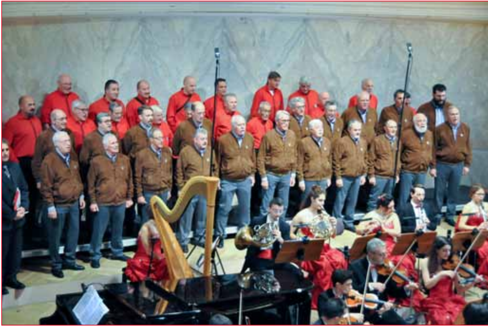
Tre compagini storiche della Federazione presenti sul palco: Monti Pallidi (in uniforme rossa), Castel Flavon e Laurino che, insieme, hanno formato il Coro Catinaccio.

sono esibiti in un ruolo "eroico" di stampo operistico per loro inedito con il sostegno dell'orchestra "Antiqua Estensis".