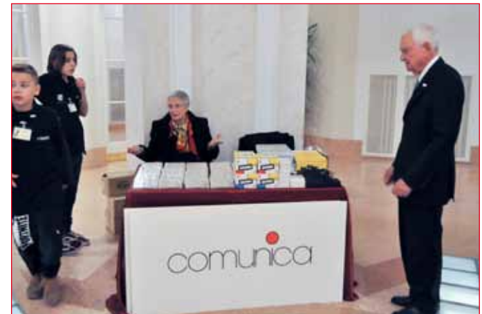
Presente anche la Società Comunica di Padova, oltre alla Provincia Autonoma ed alla Federazione Cori con stand illustrativi delle attività.