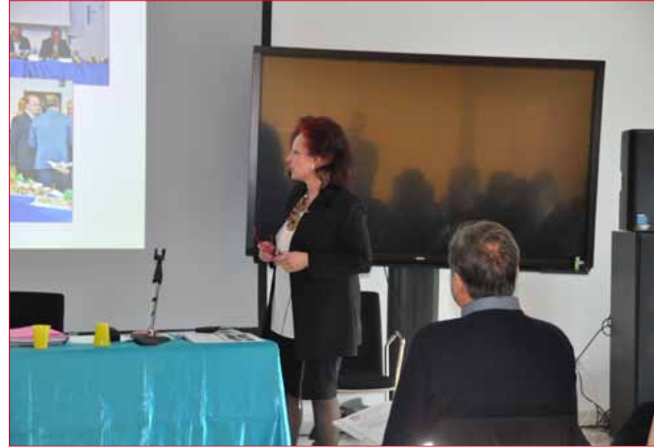
La Presidentessa presenta l'attività svolta e programmata per l'anno a venire.