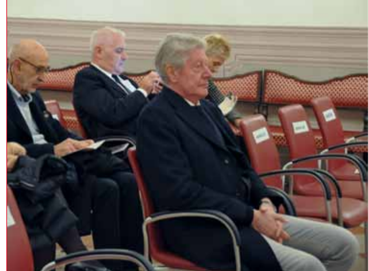
Il Sindaco di Bolzano Renzo Caramaschi.