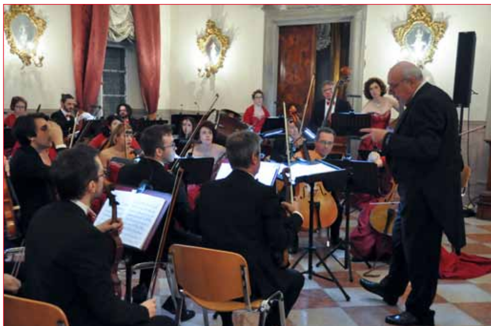
Grande l'affiatamento fra Direttore ed orchestra.