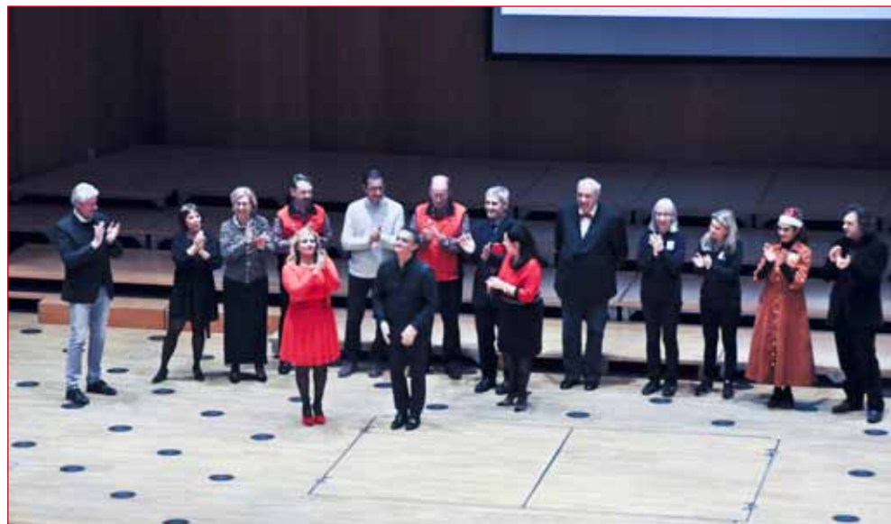
Molto calorosi e davvero meritate gli applausi ai Direttori, preparatori ed accompagnatori.