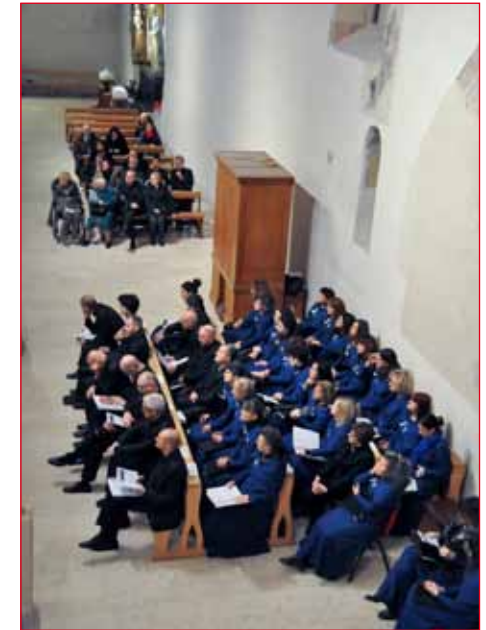
La due Corali protagoniste in attesa di esibirsi. A destra la corale Non Nobis Domine, a sinistra quella di Sommariva.