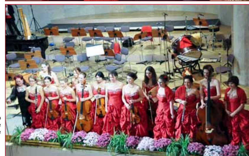
Foto di gruppo in onore delle concertiste