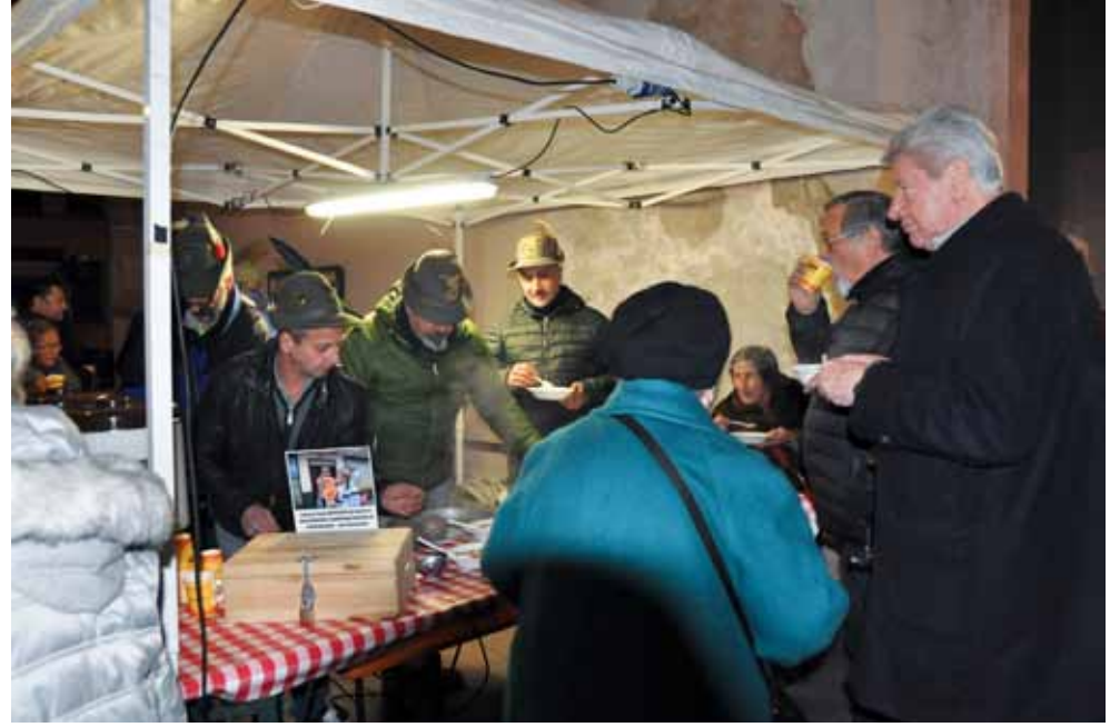
Molto gradito il ristoro offerto dal gruppo Alpini Bolzano Centro.