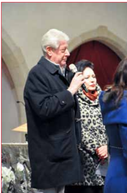
Il saluto del Sindaco di Bolzano, Renzo Caramaschi.