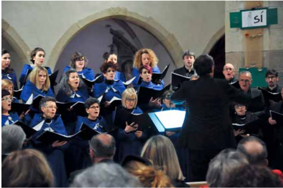
La Corale Polifonica Non Nobis Domine, Merano